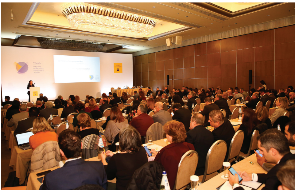
Με αμείωτο ενδιαφέρον, οι συμμετέχοντες παρακολούθησαν τις παρουσιάσεις των διακεκριμένων ομιλητών.